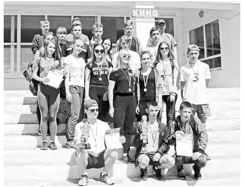
Спортсмены СОШ № 1 во всех группах были лидерами. На фото команды 5 — 9 классов и старшеклассников

3) получили денежное поощрение от администрации района.