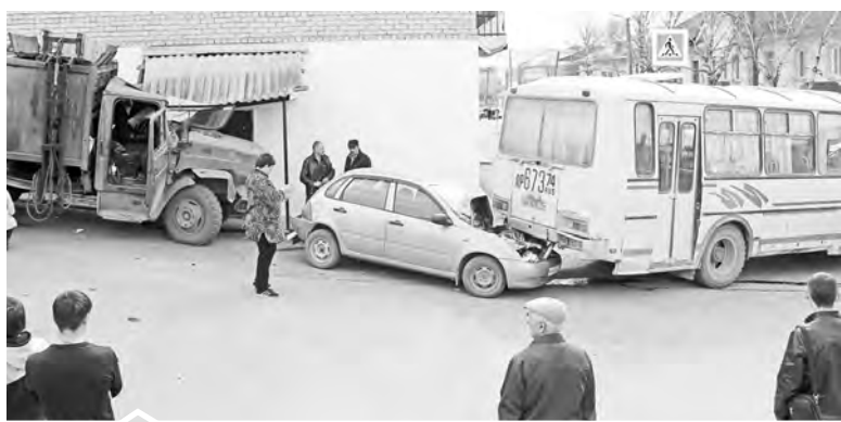
Вот что увидела хозяйка «Лады Калина», когда вернулась из аптеки