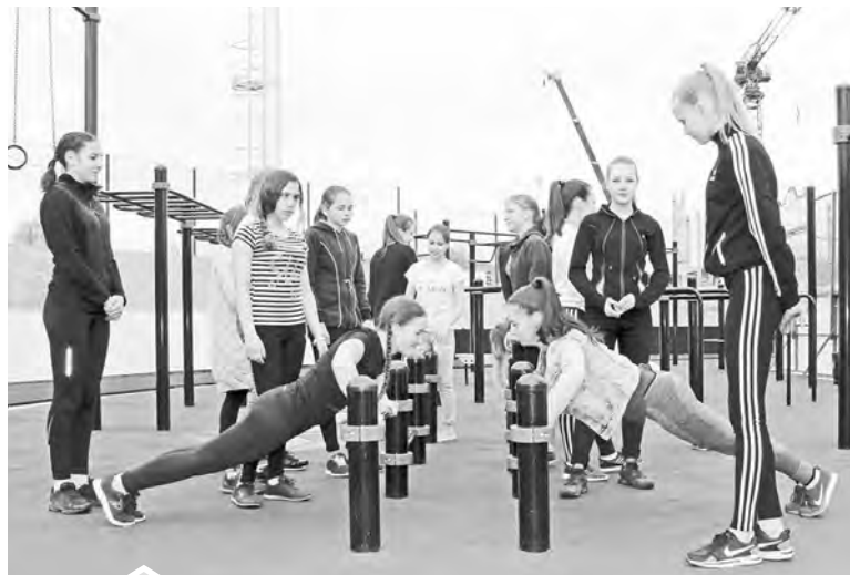
Площадка для воркаута — лишь малая часть спортивного сооружения, построенного РМК в Карабаше. И она не пустует!