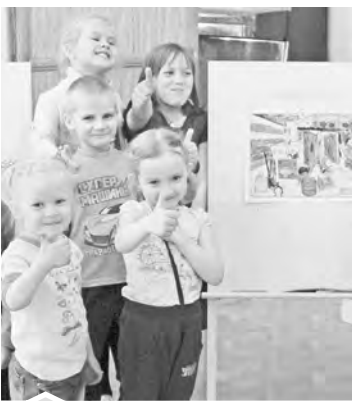
В музее понравилось всем!