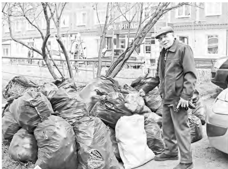
Жители многоквартирных домов собрали мусор, и теперь они вправе ожидать, что его быстро вывезет управляющая компания

Большинство старших по дому, входящих в координационный совет, пенсионеры. И поначалу они