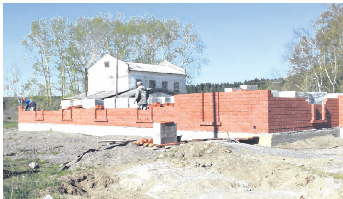
Работа на стройке идет полным ходом, прерываясь лишь на один выходной в неделю

Сразу после майских праздников в районе РММ началось строительство мечети