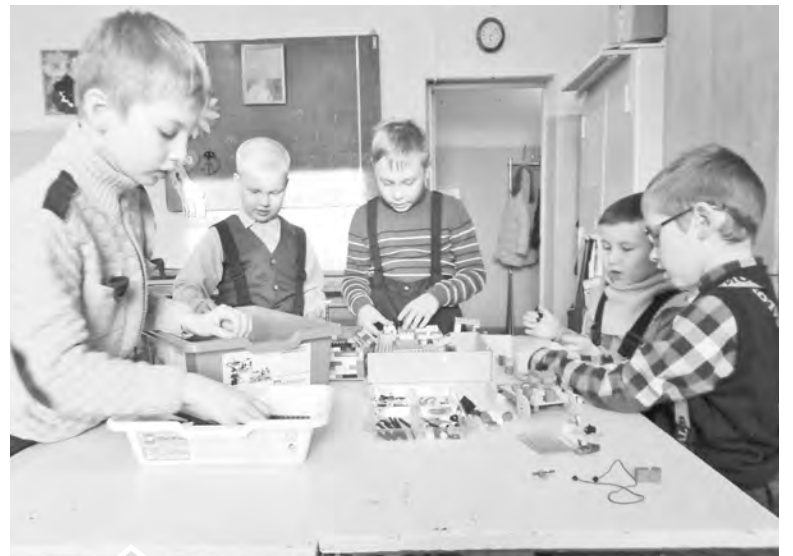
Первоклассники с удовольствием посещают кружок «Роботенок» (руководитель Т. В. Харланова)

получают дополнительное образование в СЮН, СЮТ, ДУМ, ДШИ и спортивной школе. Их обучают 40 педагогов и тренеров