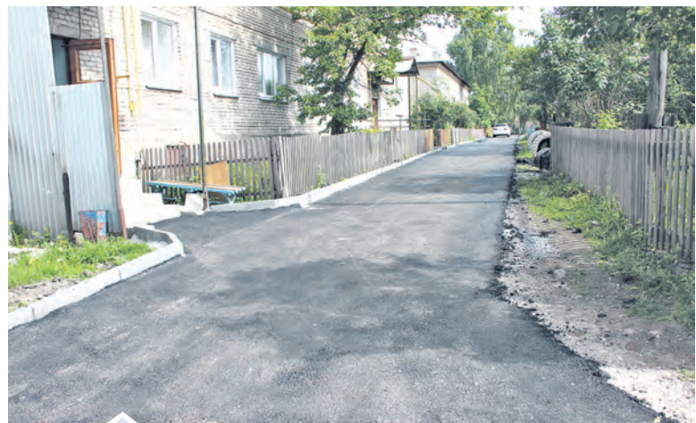
Новый асфальт возле дома 14 на ул. Карла Либкнехта радует и жильцов дома, и прохожих

Полным ходом идут работы по асфальтированию междворовых проездов и придомовых территорий в рамках реализации программы «Формирование комфортной городской среды».