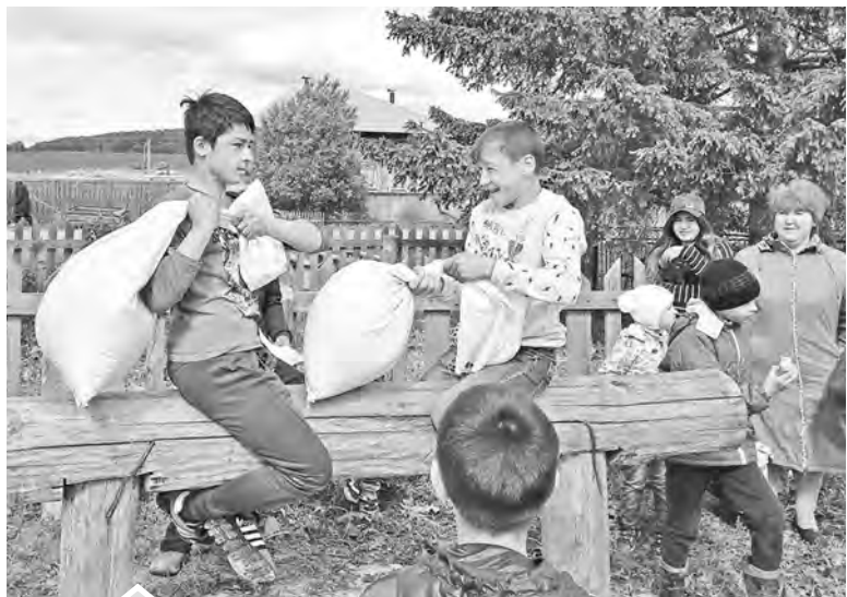
Юные ташкиновцы с азартом участвовали в конкурсах и спортивных состязаниях

полутора часов создавали хорошее настроение немногочисленным