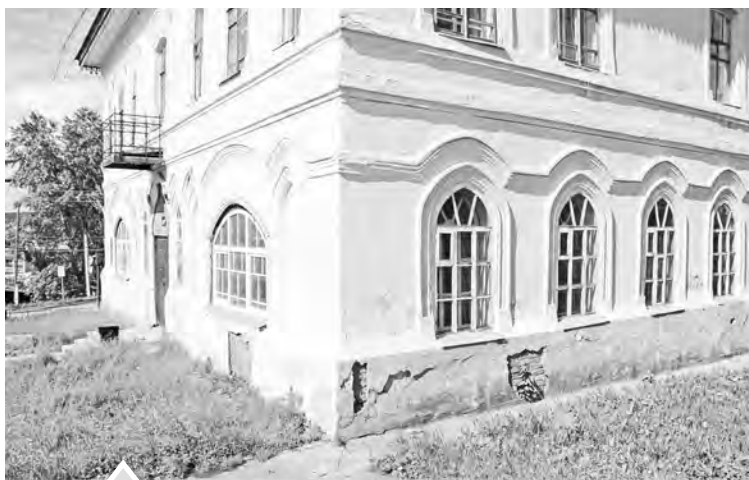
Пока музей выглядит не лучшим образом, но придется подождать