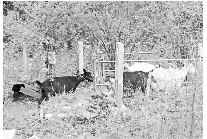
Козам на кладбище, как в басне Крылова, «под каждым кустом готов и стол, и дом»

Несколько лет назад мы хотели поставить металлическую изгородь, чтобы уж раз и навсегда. Планировали по 20 — 30 метров изгороди каждый год делать, но денег в бюджете не хватает, а сделать нормальный забор стоит недешево. Мы и так каждый год на содержание кладбища добавляем. Начинали с 30 — 40 тысяч рублей. При формировании бюджета города на 2019 год будем просить депутатов, чтобы добавили денег именно на ремонт изгороди.