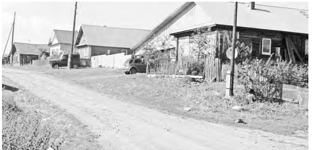
Деревня старая — дома новые