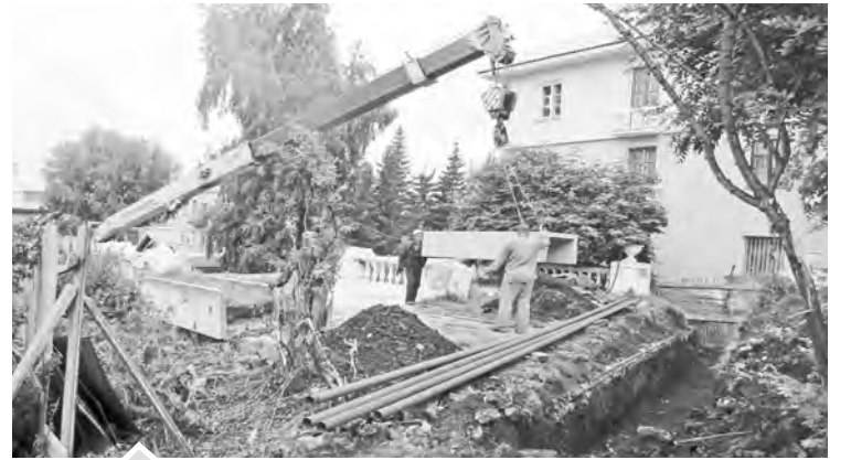
Меняй трубы загодя