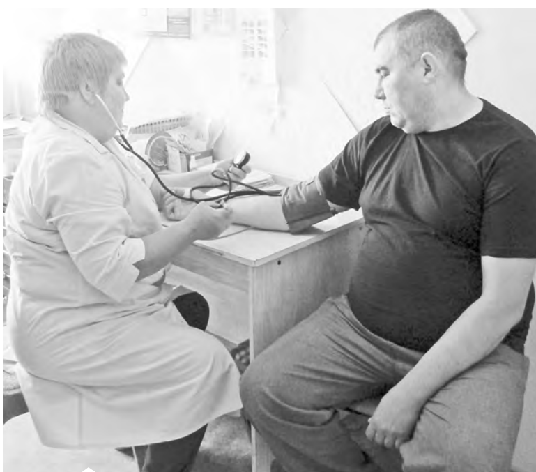
Любое заболевание легче предупредить, чем вылечить!

Министерство здравоохранения РФ на основании статистических данных проводит регулярную корректировку перечня обследований в рамках диспансеризации. Из-за отсутствия в медучреждениях требуемого оборудования, низкой информативности в 2018