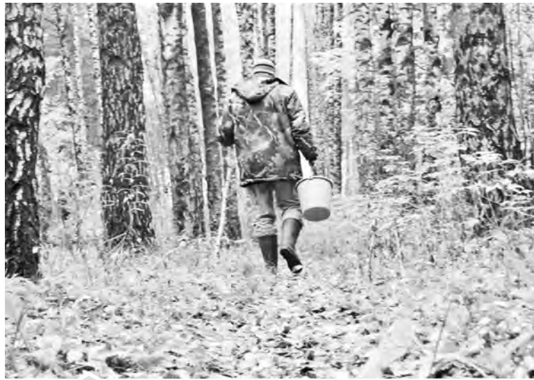
Лес не терпит беспечности

● Возьмите все необходимое. Собираясь в лес, обязательно возь-