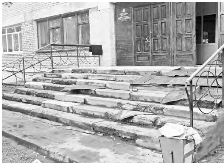
Скоро на отремонтированном крыльце по традиции будут фотографироваться школьники

С крыльцом-то проблема решилась, а вот с новыми окнами школе придется еще подождать. По соглашению сторон ранее заключенный договор с предпринимателем из Златоуста был расторгнут. Сейчас объявлен новый аукцион по определению подрядчика. Он состоится 27 августа. Напомним,