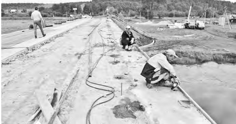
Работы на мосту в Шемахе в полном разгаре