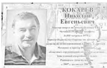
Пример, достойный для подражания

внесли друзья и семья спортсмена, сотрудники фотостудии «Спектр» разработали дизайн доски и заказали ее в Екатеринбурге.