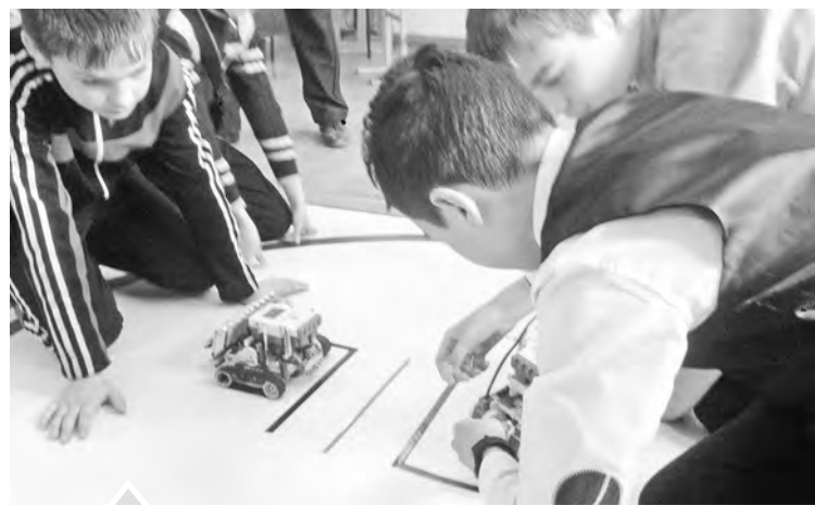
Битва роботов — битва интеллектов