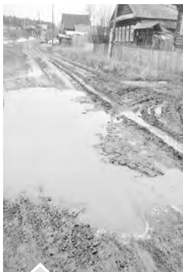
Жителям Межевой не позавидуешь!