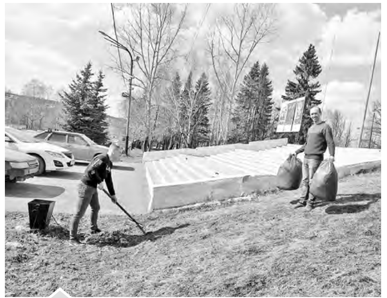
Работники РДК порядок уже навели

Министерство экологии Челябинской области запустило «горячую линию» для приема обращений от граждан по вопросам вывоза ТКО. Если вы заметили контейнер, переполненный отходами после субботника, обращайтесь по тел. 8-922-758-32-07 или в официальные профили Министерства в социальных сетях ВКонтакте и Инстаграм. Номер телефона «горячей линии» регионального оператора по обращению с ТКО ООО «Спецсервис» — 8 (35151) 2-01-21.