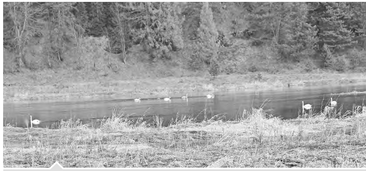
Чтобы красота спасла мир, мы должны сберечь красоту

жители любят грациозными птицами из окон автотранспорта, многие специально приезжают и приходят к месту стоянки лебедей, чтобы сфотографировать их или снять на видео. И все замечают, что один из лебедей всегда держится чуть поодаль от своих соратников. Почему их семь, ведь, как известно, лебедь — птица парная? Может,