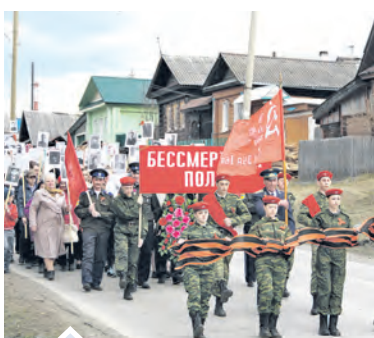
Бессмертный полк и нынче пройдет по улицам Нязепетровска