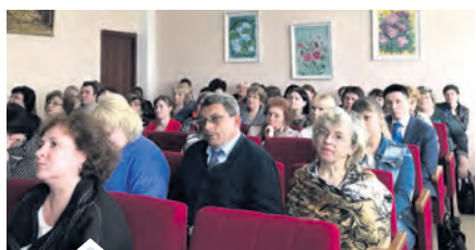
Заседание совета проходило в РДК

По итогам выездного медицинского совета Нязепетровская районная больница получила удовлетворительную оценку своей деятельности.