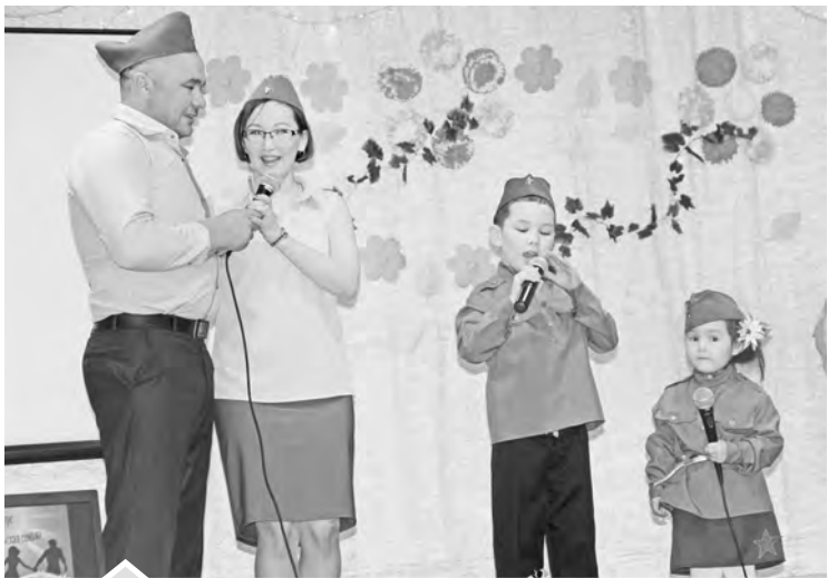
Закировы показали себя очень творческой семьей