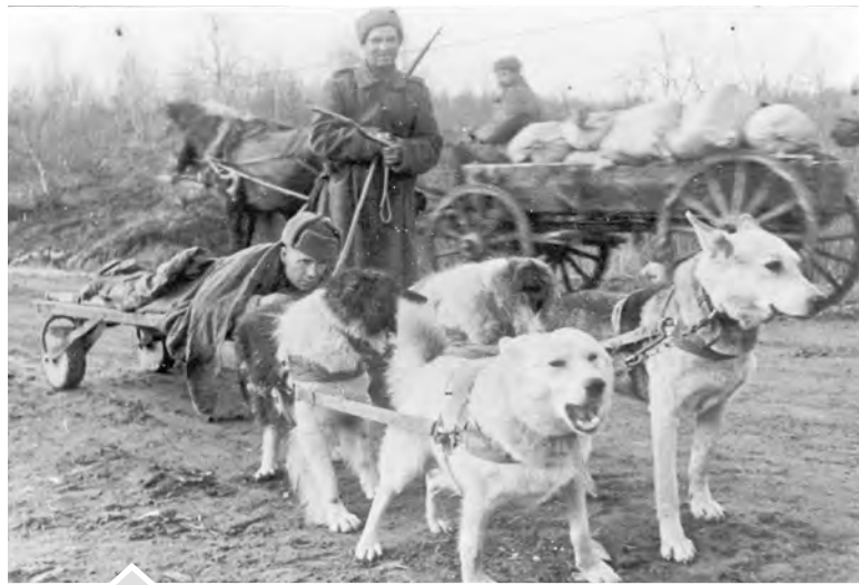
Неизвестные герои войны