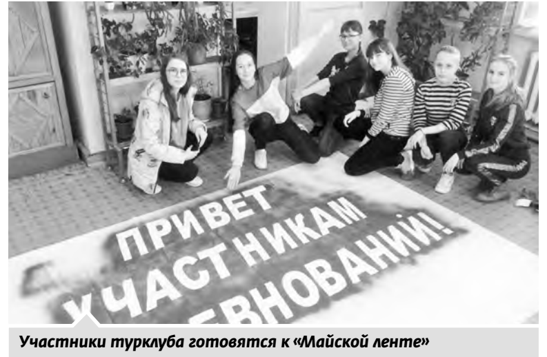
Участники турклуба готовятся к «Майской ленте»

Возвращаясь к турклубу. Чтобы дети по вечерам не болтались, было решено создать на базе СЮН турклуб. Инициатором идеи