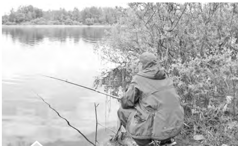
В ожидании клева рыбакам доводится видеть много «интересного». Главное — не закрывать на это глаза.

— Основная причина этого нам видится в незаконном, хищническом отлове рыбы в нерест, когда ей не дают отнереститься, и из-за этого год от года положение на водохранилище все хуже. Обращаемся ко всем добропорядочным рыбакам и ко всем жителям с просьбой оперативно сообщать обо всех случаях незаконной рыбной ловли. Сделать это можно, позвонив на круглосуточный телефон горячей линии в Нижнеобское территориальное управление Федерального агентства по рыболовству 8 (3452) 33-85-45, или в Челябинский отдел государственного контроля по рыболовству по телефону 8 (351) 263-36-85. Можно зафиксировать браконьеров на фото и видео, отправить в группу «Подслушано в Нязепетровске», позвонить в управление сельского хозяйства (тел. 3-12-56), в редакцию газеты (3-13-64), в ЕДДС, мы среагируем на каждый случай, — обращается к жителям начальник управления сельского