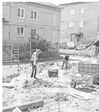
Идут работы во дворе дома № 13 на ул. Щербакова

В этом году в рамках программы «Комфортная городская среда» планируется благоустроить 15 нязепетровских дворов.