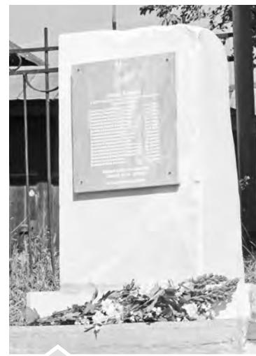
Через века, через года, — помните...

В день памяти о тех, кто защищал нашу страну от фашизма и принес нам мир, была объявлена минута молчания. И как подтверждение мирной жизни раздалось в тишине веселое птичье