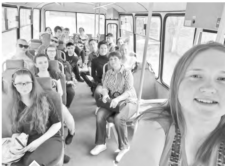
Экскурсия ребятам понравилась!

СПЭСВТВ (специализированное предприятие по эксплуатации сооружений внешнего тракта водоснабжения) — это целый комплекс технологических служб, который обеспечивает работу насосных станций и гидроузла Нязепетровского водохранилища. С виду это большое предприятие напоминает маленькое государство. Здесь трудятся люди самых разных профессий: токари, сварщики, плотники, каменщики, маляры и многие другие. Работники строго соблюдают чистоту на всей территории комплекса и в радиусе нескольких десятков метров вокруг. Увидеть брошенную бумажку или любой другой мусор здесь просто невозможно. Также на территории предприятия находятся ремонтно-механические мастерские, газовая котельная, гараж и строительный цех.