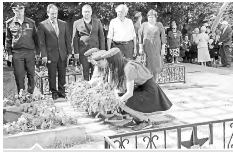
Это нужно — не мертвым! Это надо — живым!