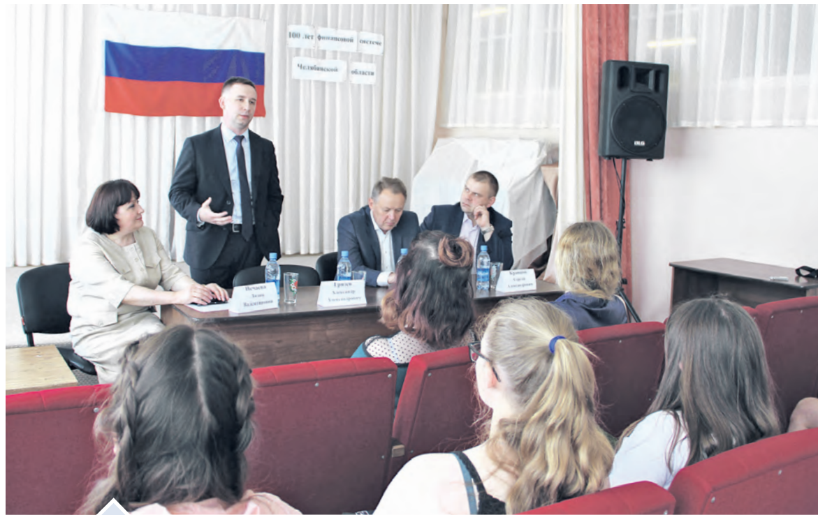
Урок финансовой грамотности получился познавательным и неформальным