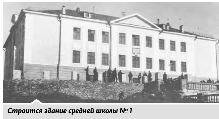
Строится здание средней школы № 1