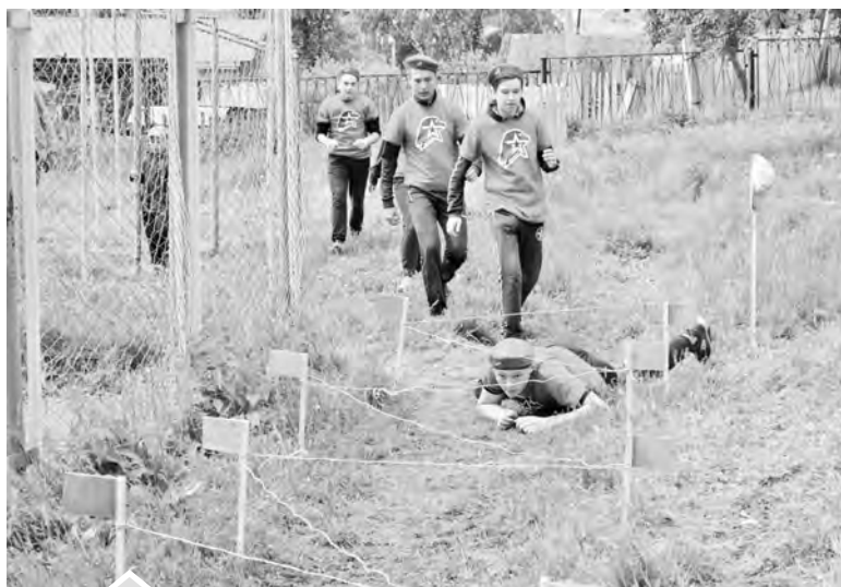
На полосе препятствий

М. Хажипов, начальник штаба МО ВВПОД «Юнармия» в Нязепетровском районе: — Большое спасибо всем, кто оказал помощь в проведении соревнований: управление по молодежной политике, физкультуре и спорту предоставило грамоты и кубки, СЮН — оборудование для этапов по туристской технике, казаки помогли установить флажки и помогли в судействе, родители младшей группы юнармейцев СОШ № 2 помогли изготовить часть оборудования.