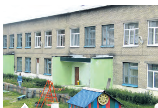
Пока в детском саду «Малышок» новые окна соседствуют со старыми. Но скоро ситуация изменится.