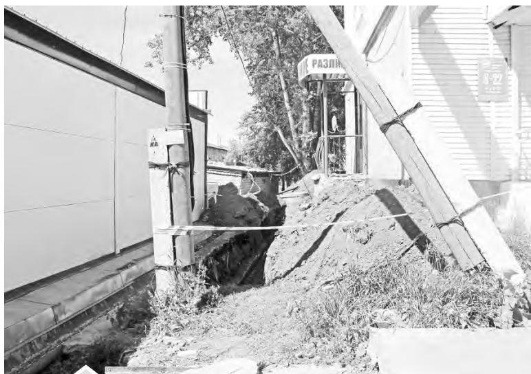
Столб преткновения на пути к ремонту теплотрассы

Если решение проблемы с сараями и киосками обошлось в несколько потерянных дней — в районе сараев трассу вывели над землей, а частные киоски пришлось снести, то со столбом, который питает электроэнергией все торговые точки рынка и несколько жилых домов,