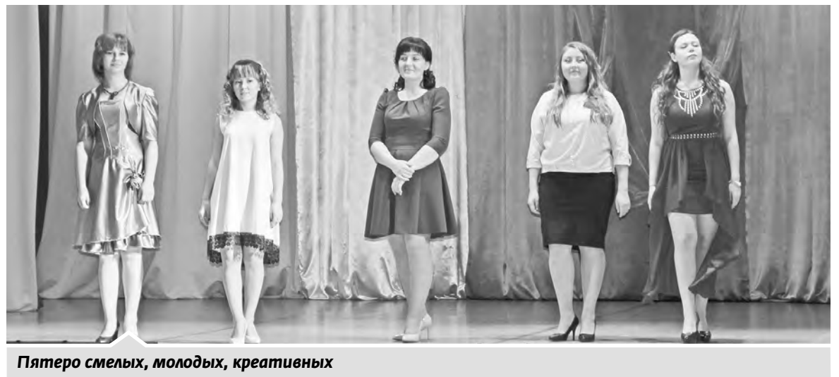
Пятеро смелых, молодых, креативных