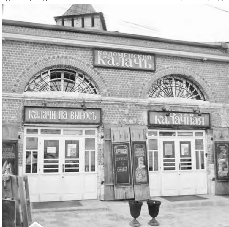
Ради неспешного чаепития с горячими коломенскими калачами люди готовы ехать за сотнями километров