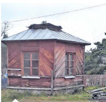
Внутри часовни уже начались восстановительные работы