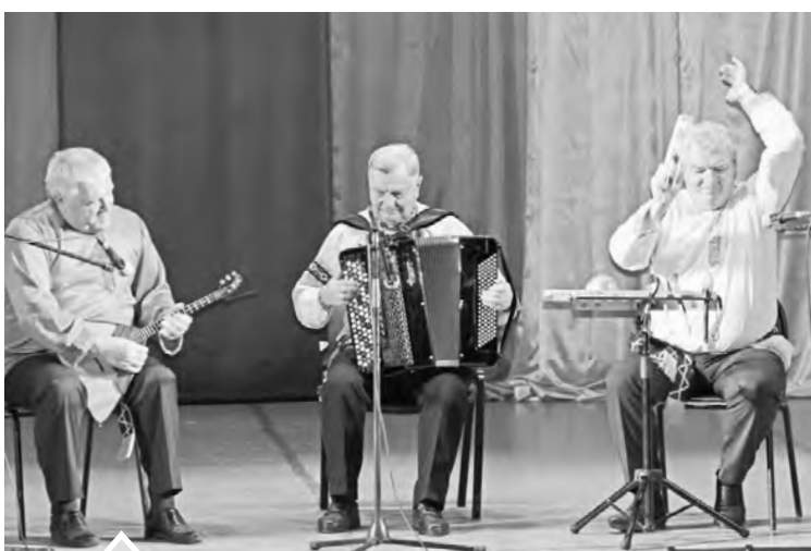
Трио инструменталистов из г. Касли порадовало шуточной песней

—В Нязепетровском районе высокая культура национальных отношений. Думаю, фестиваль станет традиционным мероприятием на территории района.