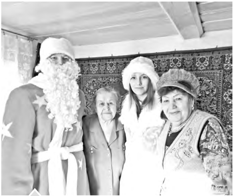
В Ункурде Дед Мороз и Снегурочка радовали не только детей, но и взрослых