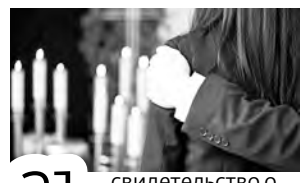
21 свидетельство о смерти: на 15 мужчин, 6 женщин