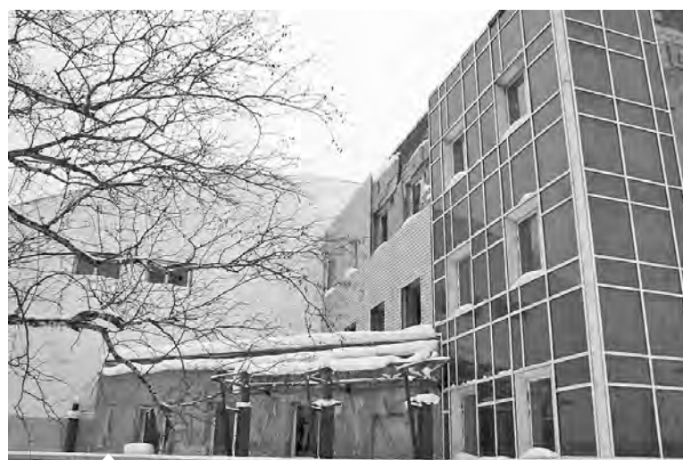
106 млн. рублей будет выделено на продолжение строительства ФСК в ближайшие два года

— В ближайшие годы бюджетная политика будет ориентирована на развитие человеческого потенциала, поэтому большой объем средств — это социальные инвестиции, — отметила Лидия Валентиновна. — В области образования