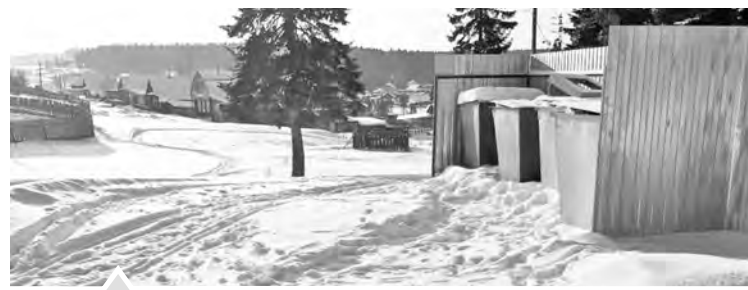
После снегопада у жителей ул. Труда возникло предчувствие экологической катастрофы