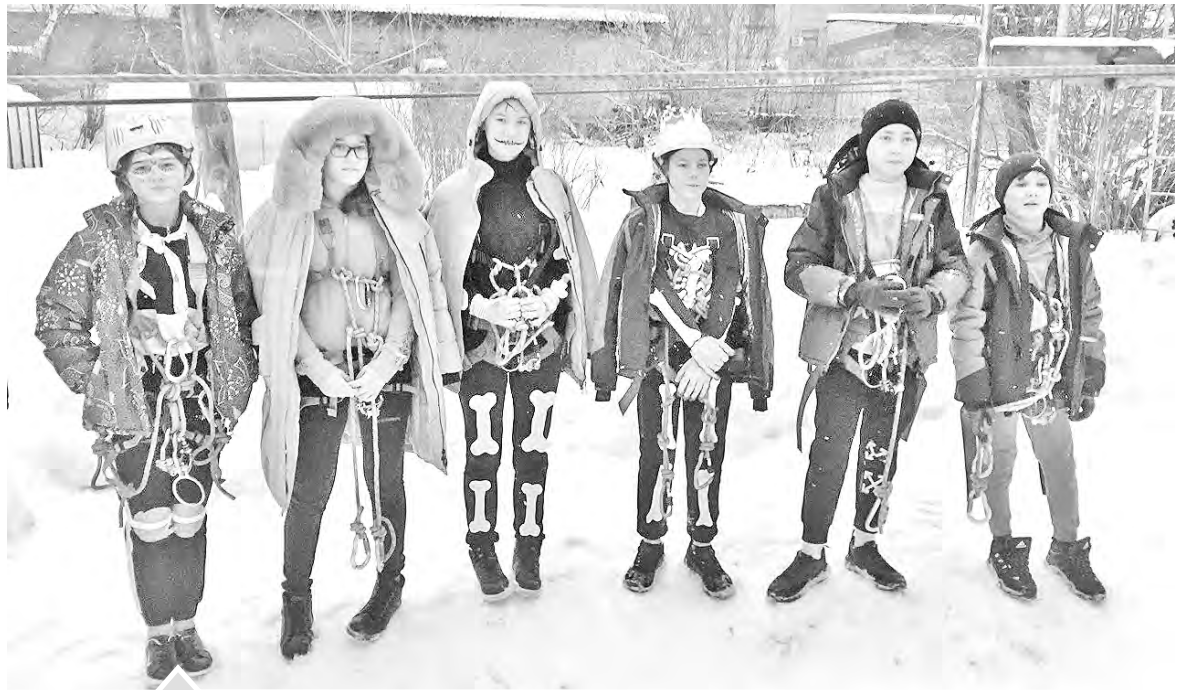
Юные туристы центра помощи детям, оставшимся без попечения родителей, начали новый год с победы

В наступившем году у туристских команд района появились зимние состязания на свежем воздухе