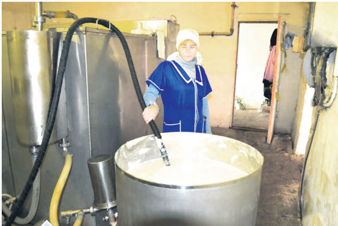
Молоко долгие годы было основной продукцией ташкиновцев

Меньше молока, телят, мяса получили животноводы района в 2019 году