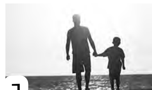
1 установление отцовства