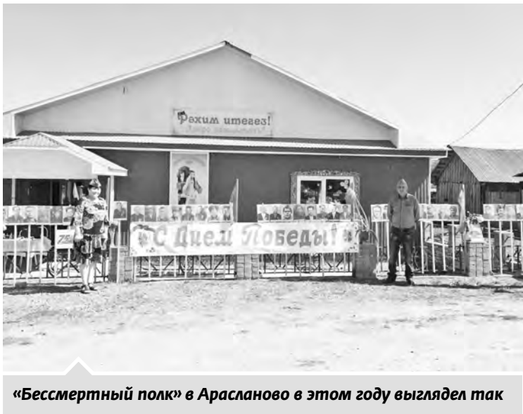
«Бессмертный полк» в Арасланово в этом году выглядел так