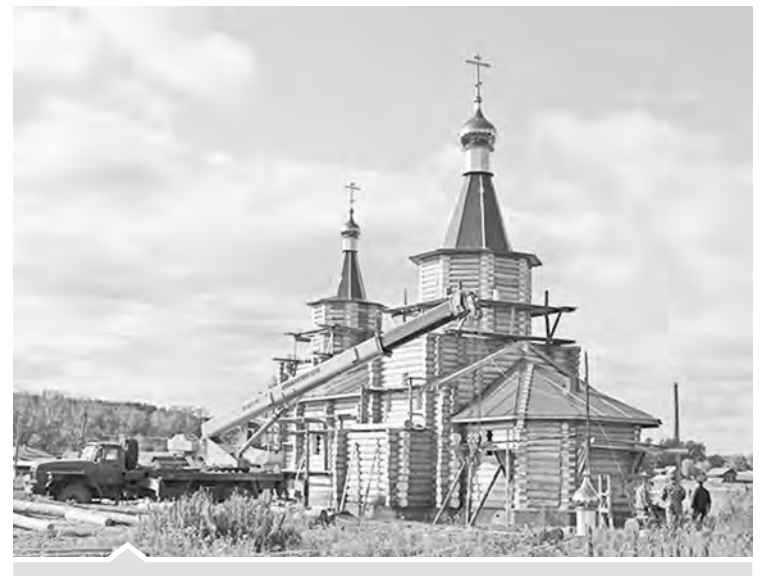
Строительство Свято-Троицкого храма в Шемахе

Н. КИСЛОВ, научный сотрудник МВЦ Продолжение следует