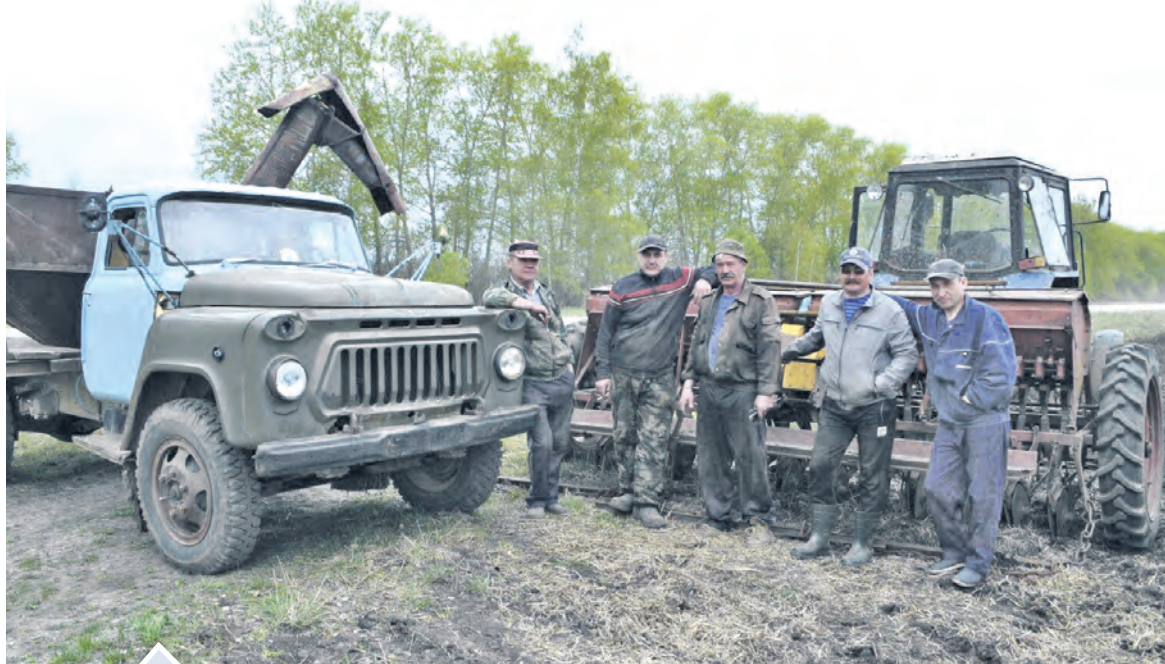
У механизаторов СПК «Ташкиново» — горячая пора, времени на передышку практически нет. Разве чтобы попозировать для фото в районную газету!

В Нязепетровском районе полным ходом идет посевная кампания