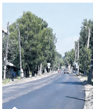
Пока асфальт уложили по одной стороне

Наверное, еще ни одну подрядную организацию в Нязепетровске не ждали с таким нетерпением, как златоустовскую фирму ООО «УралСтрой», которая должна была завершить ремонт улицы Ленина еще на прошлой неделе, но заехала в город только в этот вторник.