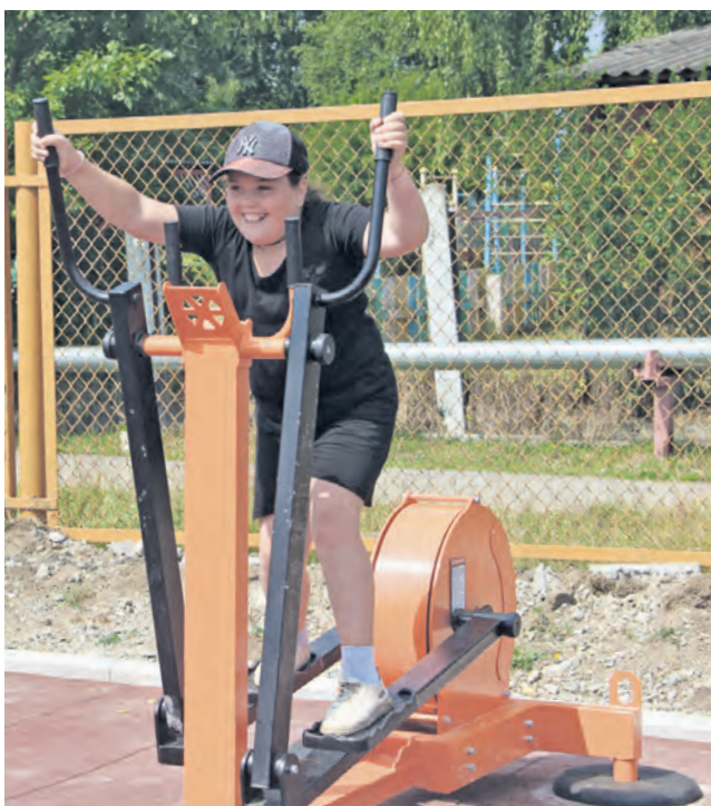
Маленькие жители Нязепетровска — большие любители спорта

10 июля на стадионе «Локомотив» состоялось торжественное открытие первой в районе спортивной площадки ГТО.