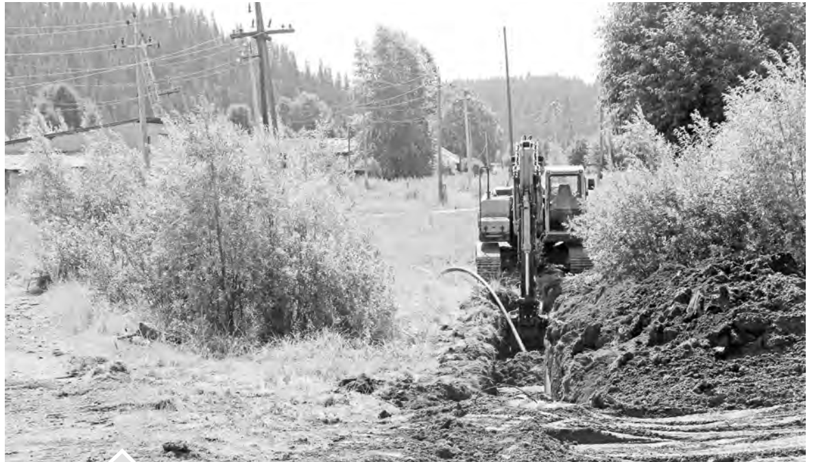
Ремонт водопровода в районе РЭС

Продолжается подготовка объектов ЖКХ района к новому отопительному сезону