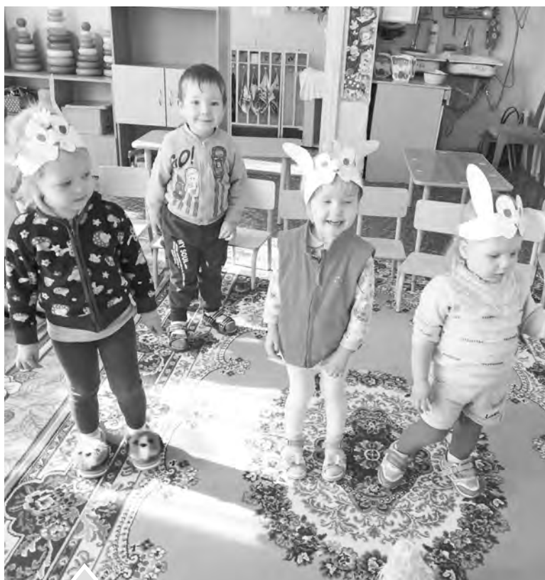
Летом в Ункурдинском детсаду «Светлячок» отремонтировали пол и потолок

В рамках благоустройства территорий школ по программе «Реальные дела» выполнен ремонт ограждения и проведено частичное асфальтирование дорожек в Шемахинской СОШ, оборудована спортивная площадка в Ункурдинской СОШ, сейчас ведутся работы на спортплощадке Первомайской СОШ — спортобрудование установлено, осталось