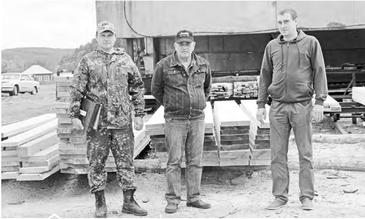
Работники ИП Кузнецов В. Г. с поставленными задачами справляются