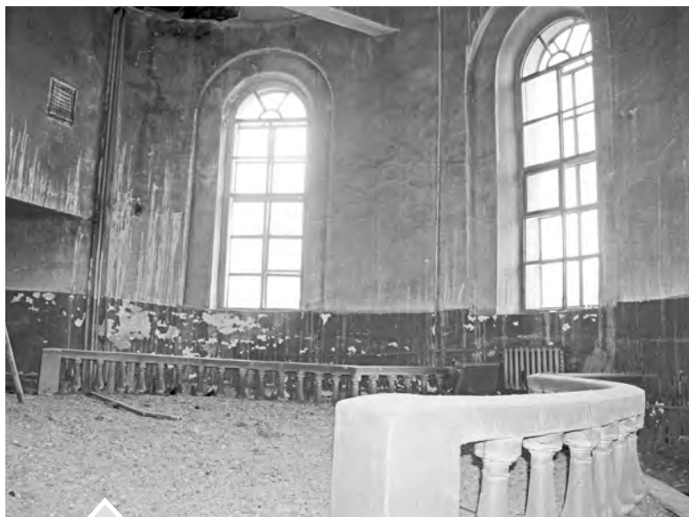
Размещение в храме кинотеатра помогло сохранить здание до наших дней — считают служители церкви