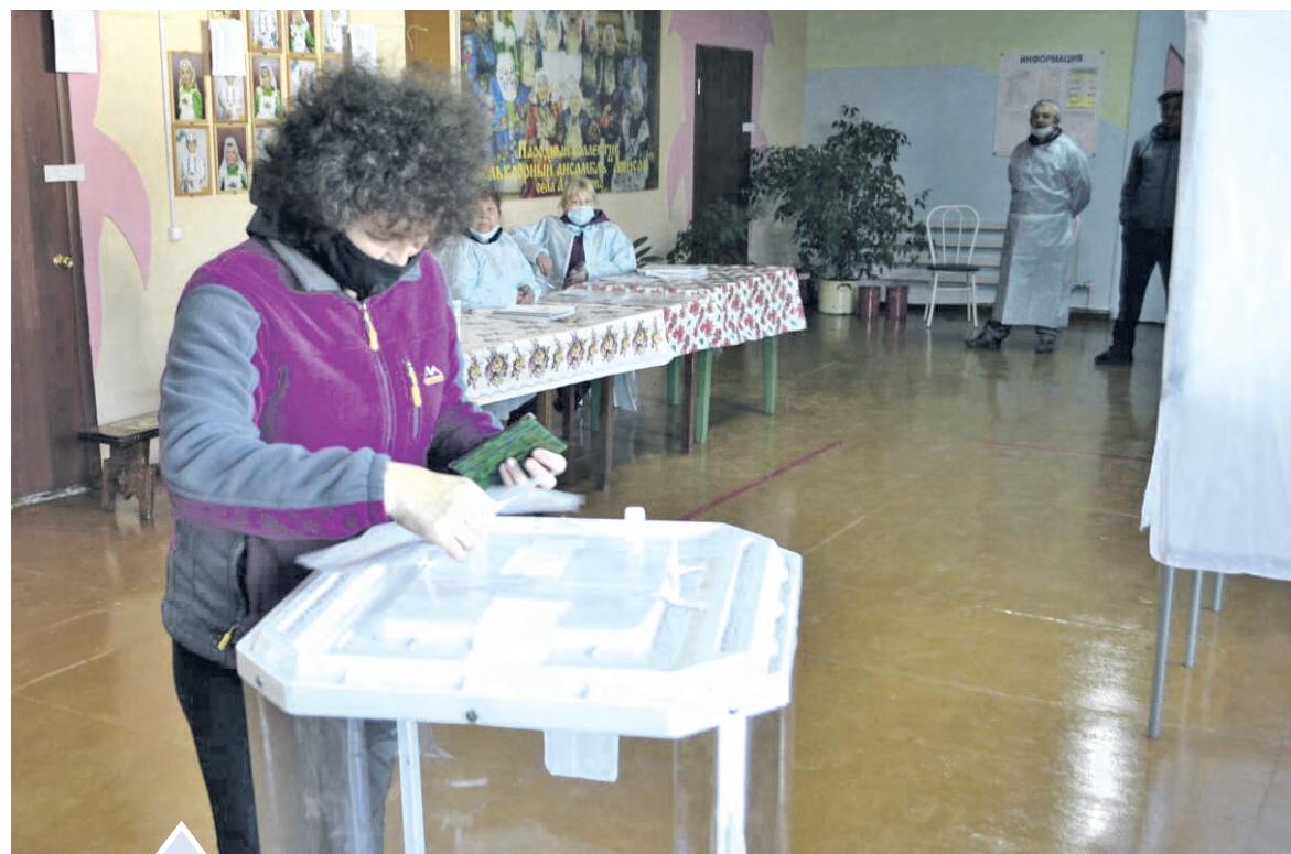
Нязепетровцы выбрали тех, кто в ближайшие пять лет будет решать судьбу области, района, города и сельских поселений

Нязепетровцы сделали свой выбор, отдав голоса за достойных, по их мнению, кандидатов