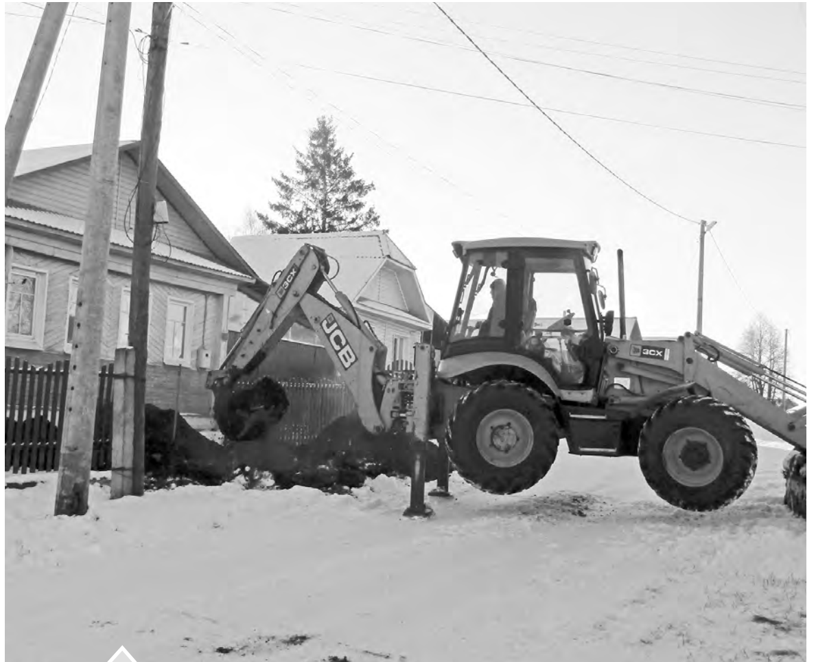
На этой неделе подрядная организация вела работы на улицах Лесной и Патриса Лумумбы

Жизненность этой немного перефразированной пословицы подтвердила ситуация, случившаяся при газификации ж/д микрорайона