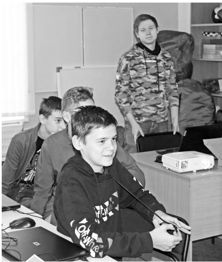
Современные технологии вызывают у школьников живой интерес

В нашем городе «Мобильный кванториум» начал свою работу на базе СОШ №1, но возможность освоить современные технологии