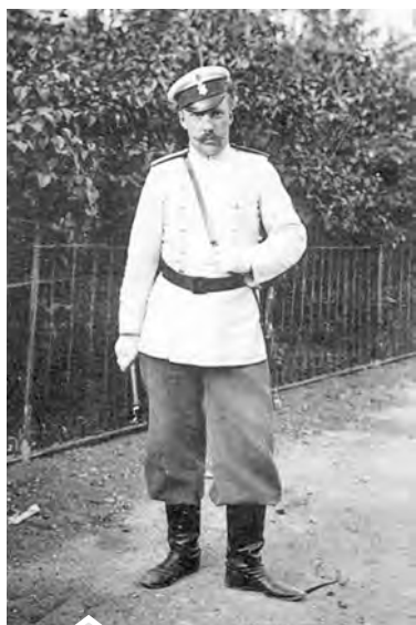
Полицейский урядник Нязепетровского завода