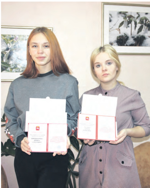
Награждение прошло в камерной обстановке, но это не умаляет торжественности момента