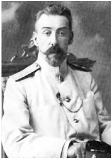
Губернатор Пермской губернии И. Ф. Кошко

В соответствии с Декларацией Временного правительства о его составе и задачах от 3 марта 1917 года было принято решение о замене полиции народной милицией. Фактически переименование полиции в милицию не было связано с принципиальным изменением структуры формирования правоохранительного органа. Она оставалась профессиональным органом,