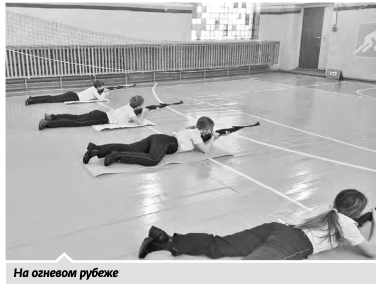
На огневом рубеже