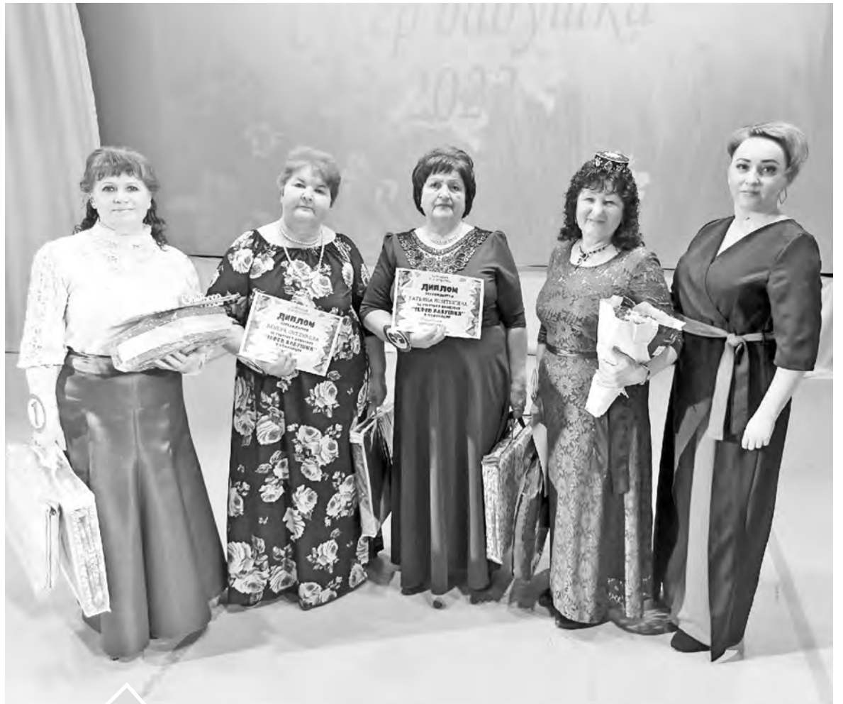
Своим примером конкурсантки продемонстрировали, как надо жить, не унывать и побеждать невзгоды

1 апреля в РДК выбирали самую активную, обаятельную и молодую душой бабушку Нязепетровского района