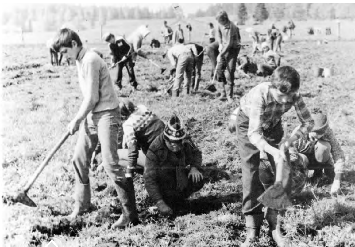
Пионеры на прополке сосёнок

— В Нестеровской восьмилетней школе пионерская дружина носила имя Павлика Морозова. В нашей