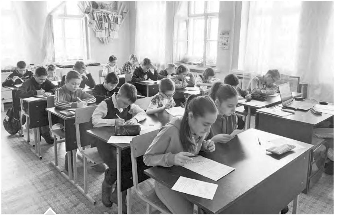
Нязепетровские школьники — активные участники олимпиад