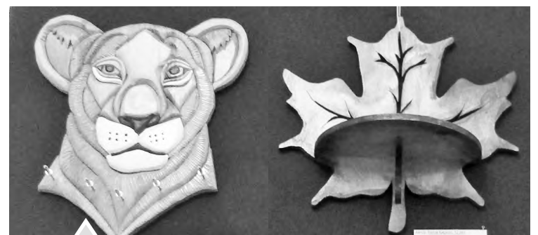
Работы, выполненные в технике «Интарсия по дереву»