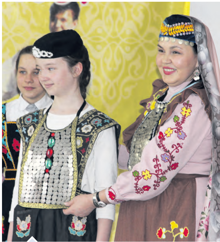
Участники фестиваля смогли примерить башкирские национальные костюмы