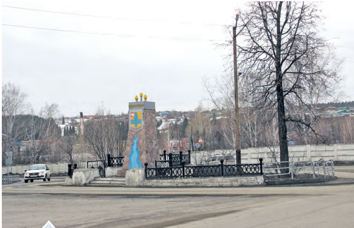
По мнению нязепетровцев, сквер нужно благоустроить в первую очередь

В Нязепетровске определили проекты, которые будут реализованы в рамках программы инициативного бюджетирования