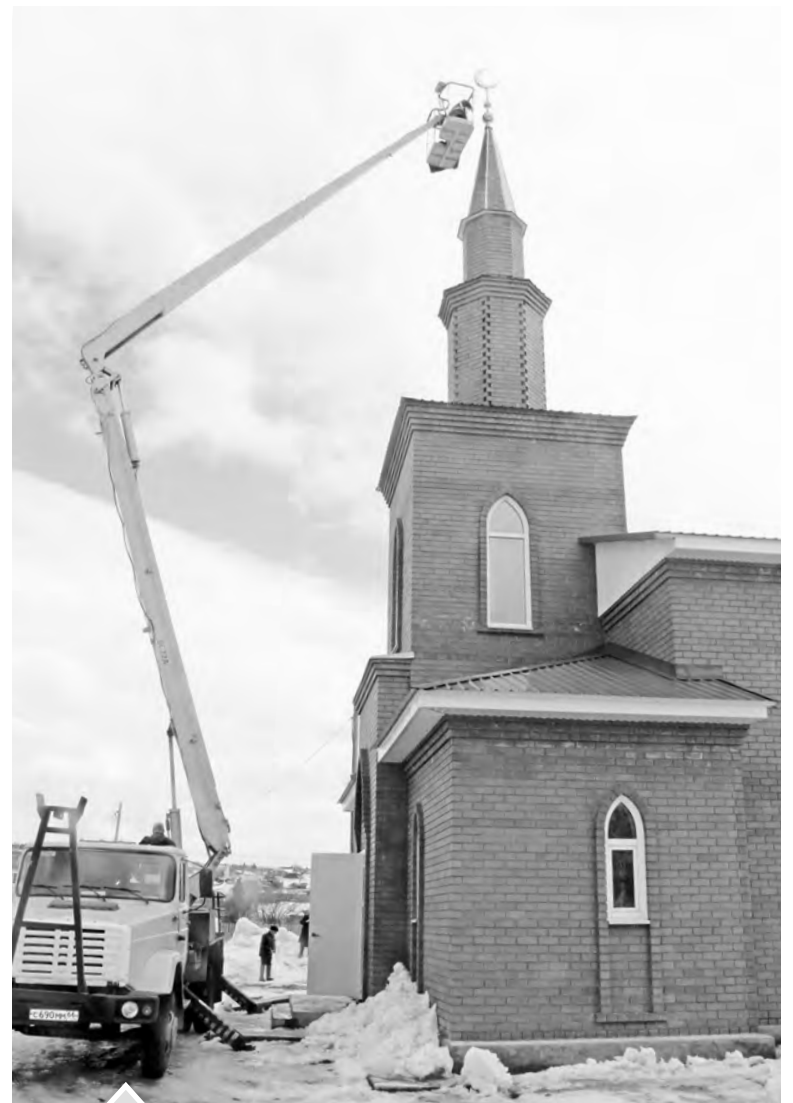
«Высотнику» из Юрюзани предстояло выполнить ювелирную по точности работу

Ну а на очереди — следующий этап работ: установка напольного покрытия и системы отопления. И здесь снова не обойтись без помощи всех неравнодушных людей, особенно учитывая, что цены на строительные материалы резко выросли. Желающие помочь в завершении строительства мечети могут