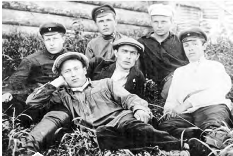
Л. И. Брежнев (в центре). 1928 г.

О том, что в пору своей комсомольской юности с мая 1928 г. по март 1929 г. будущий Генеральный секретарь ЦК КПСС, стоявший во главе советского государства в течение 18 лет, Леонид Ильич Брежнев (1906 — 1982 гг.) жил и работал землеустроителем в Шемахе, наша газета уже писала. О том, что именно Шемаха стала исходной позицией в большую политику, свидетельствует решение комсомольского бюро от 8 октября 1928 года, утвердившее комсомольскую характеристику Леонида Брежнева: «Дана настоящая характеристика члену Шемахинской ячейки ВЛКСМ тов. Брежневу Л. И. в том, что он за время пребывания с 5-го мая по октябрь месяц с/г проявил себя как дисциплинированный работоспособный и вполне подготовленный товарищ. Все возложенные на него обязанности выполнял честно и аккуратно. С отрицательной стороны тов. Брежнев ни в чём не был замечен.