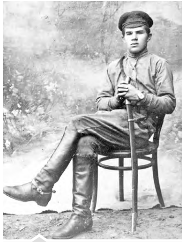
В. И. Чуйков. 1919 г.