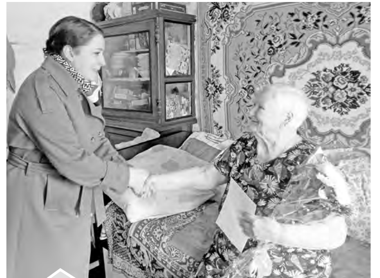
Юбилярше — поздравления от самого президента России