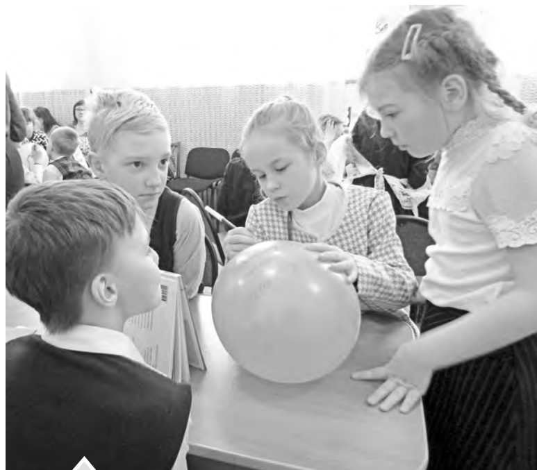
Интеллект каждого на службе у команды