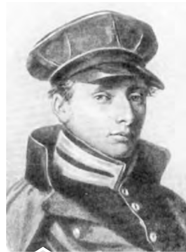
В. И. Даль

На следующий день отряд Палласа отправился дальше. Отъехав несколько вёрст, путешественники были очарованы красотой увиденных «лапландских» (северных) оленей.