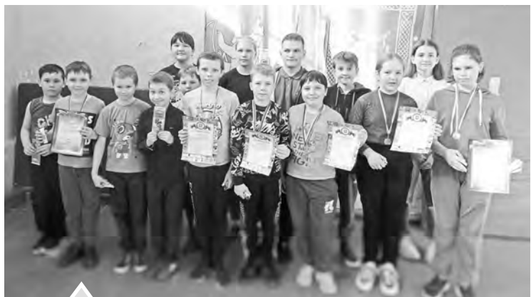
Церемония награждения для ребят — пожалуй, самая любимая часть соревнований