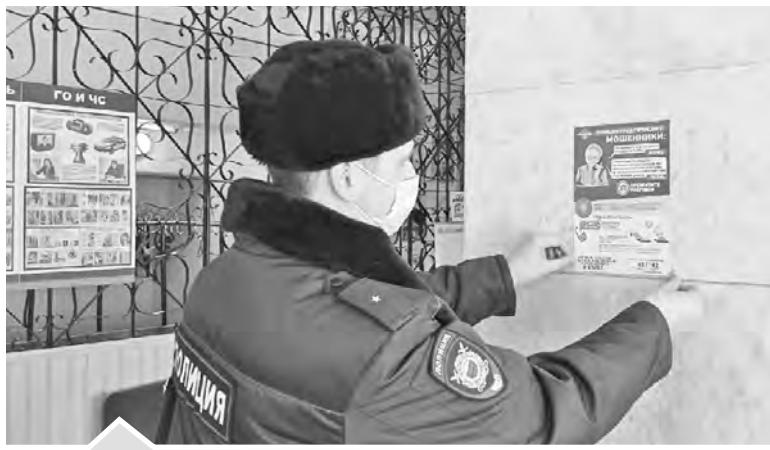
Полицейскими проводится постоянная работа по профилактике дистанционного мошенничества

За прошлый год ОМВД всего расследовано 162 уголовных дела, из них: следственным отделением