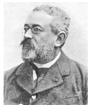
А. С. Ермолов