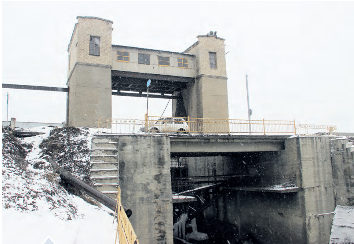
Даже если угрозы паводка нет, плотины необходимо должным образом подготовить

Накануне весеннего паводка повышенное внимание уделяется гидротехническим сооружениям